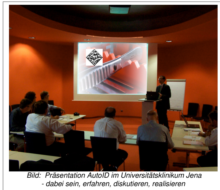
Bild: Präsentation AutoID im Universitätsklinikum Jena - dabei sein, erfahren, diskutieren, realisieren

bei der NWD - Gruppe Nordwest Dental 48153 Münster/Westfalen, Schuckertstr. 21